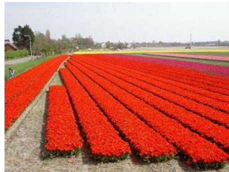
Greenport Bollenstreek: Economie en landschap.

ruimte, economie, landschap en infrastructuur. Op de analyse volgt een uitvoeringsagenda met elf onderwerpen, zoals het verbeteren van de bereikbaarheid, ruimte voor het bedrijfsleven en aandacht voor agrologistiek, distributie, kennis en innovatie. Ook toerisme en recreatie kunnen een nieuwe impuls gebruiken. Het Greenport-rapport geeft daarmee antwoord op de vraag van Rijk en Provincie om een beleidsvisie voor het gebied. Maar niet alleen de economie moet er wel bij varen: ook landschap, water en natuurkwaliteit kunnen verbeterd worden.