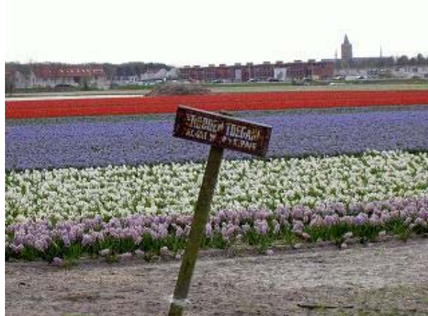
Bronsgeest-Noord in Noordwijk

locaties. Op de Zanderij in Hilllegom wil de provincie voor 2020 in elk geval niet bouwen. Op Bronsgeest-Noord daarentegen mag van de provincie wel gebouwd worden, mits de bollengrond die verloren gaat ook daar op een gelijkwaardige locatie gecompenseerd wordt.