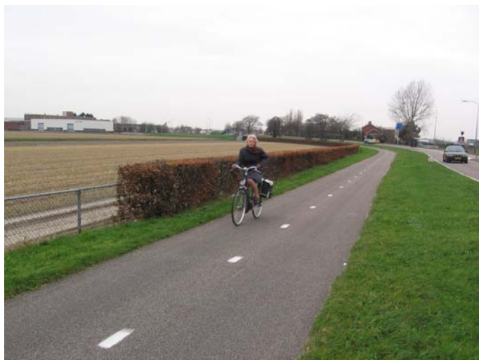
Figuur 4, Wandelen langs fietspaden b