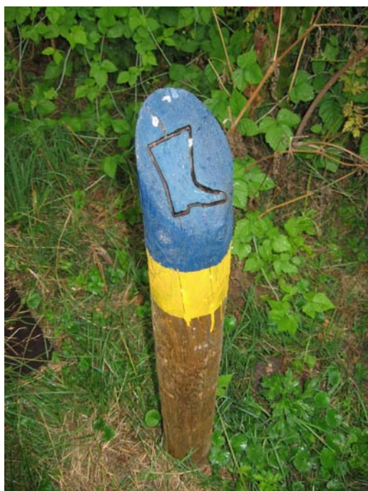
Figuur 2, Markering laarzenpad Keukenhof

Totaal zijn binnen dit project in de regio negentien gemarkeerde wandelpaden geïnventariseerd, waarvan één LAW-pad die regio-overschrijdend is. Het grootste deel, dertien van deze routes lopen over de terreinen van Staatsbosbeheer en “Stichting Het Zuidhollands Landschap”, en komen vooral in het duingebied langs de kust voor. De markering bestaat met name uit paaltjes met gekleurde koppen en zijn over het algemeen in goede toestand. De overige gemarkeerde paden worden veelvuldig gebruikt door met name recreanten uit de regio. Een belangrijk gegeven is dat dit met name korte routes betreft van drie tot vijf kilometer. Er komen maar enkele langere routes voor.