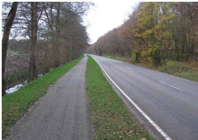
Figuur 3, Wandelen langs fietspaden a

Op de basiswandelkaart zijn deze wandelmogelijkheden gescheiden in de volgende categorieën: 'wandelen op fietspad, langs openbare weg', 'wandelen op vrijliggend fietspad', 'wandelen over openbare weg' en nog overige paden onder: 'wandelpad'.