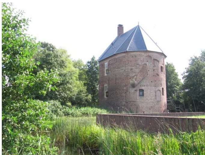
Figuur 6, 't Huys Dever

Het startpunt van dergelijke route zou het landgoed Keukenhof kunnen zijn, omdat hier al veel ontwikkelingen op recreatief gebied gaan plaatsvinden. Daarnaast is hier voldoende parkeergelegenheid aanwezig. Om draagvlak te krijgen voor deze route zal samenwerking met de stichtingsbesturen noodzakelijk zijn. Daarnaast kan de uitwerking worden opgepakt met het Cultuurhistorisch Genootschap Duin- en Bollenstreek omdat deze veel belang hebben bij de objecten binnen de route.