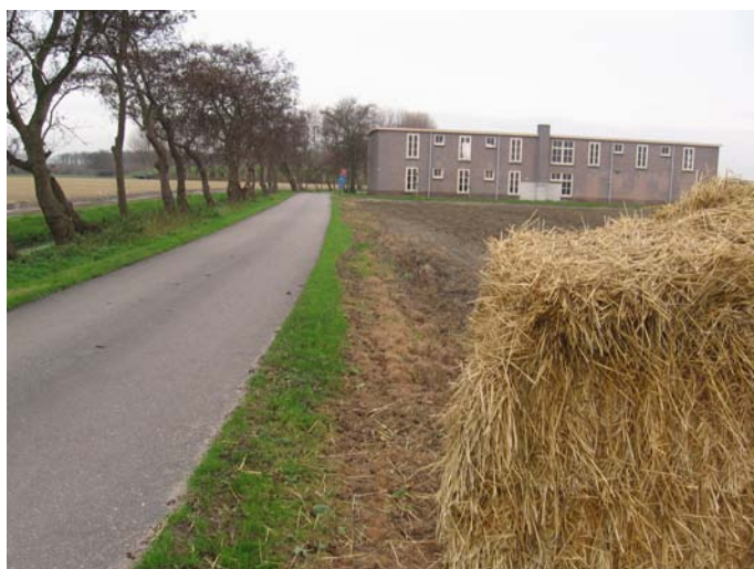
Figuur 5, Gerestaureerde bollenschuur in het landschap

De uitwerking van deze route(s) moet bij voorbaat worden opgepakt met bijvoorbeeld het Cultuurhistorisch Genootschap Duin- en Bollenstreek. Er kan uiteraard gekozen worden voor een combinatie met het openbaar vervoer om de aantrekkelijkheid te vergroten, vanwege de lengte van de route.