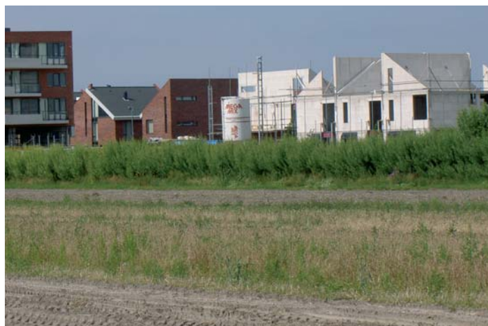
Komt de opbrengst van woningbouw in de 'Pot van Teylingen'?

PROJECTLEIDER PACT EN OFFENSIEF VAN TEYLINGEN