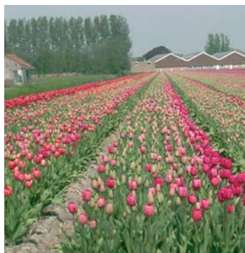
Agrarisch bedrijventerrein Pastoorslaan Hillegom