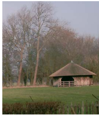
Landgoed Keukenhof Lisse

allebei bezig met toekomstplannen en recreatieve ontwikkelingen voor het gebied. Die zouden het toerisme in de Duin- en Bollenstreek een impuls kunnen geven. De regio wil de beide organisaties daarbij ondersteunen. Toerisme