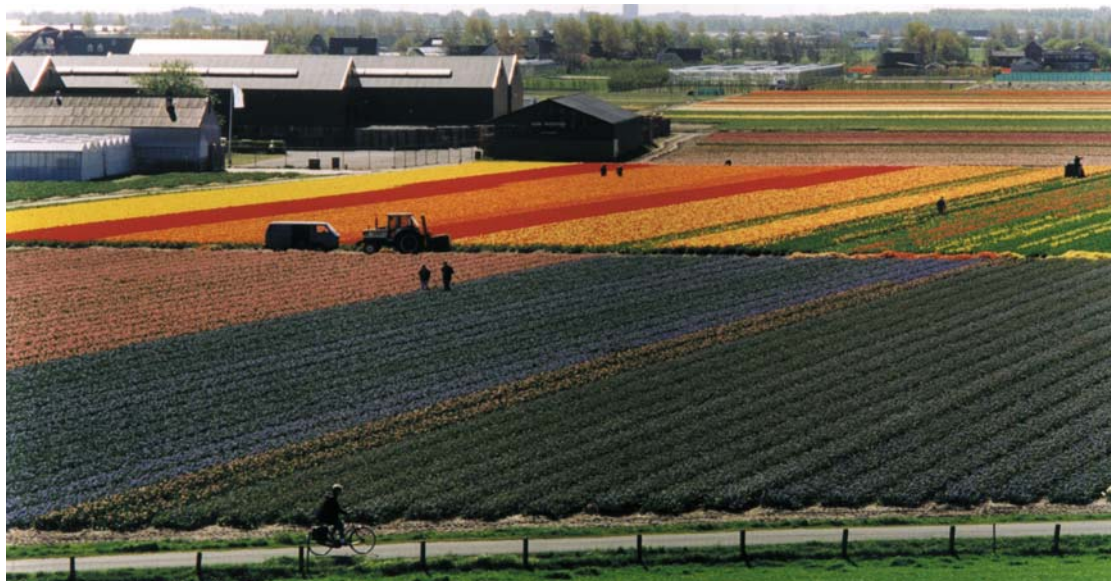
Een krachtig bollencomplex in een prachtig landschap!

Voor u ligt de eerste nieuwsbrief van het Offensief van Teylingen. Onder die naam zijn we nu ongeveer een jaar aan de slag om versnelling en uitvoering te geven aan de afspraken uit het Pact van Teylingen. Sinds enkele maanden is het team dat de projecten moet aanjagen op volle sterkte. Hoog tijd dus om te laten zien welke vorderingen er geboekt zijn en wat ons de komende maanden te doen staat.