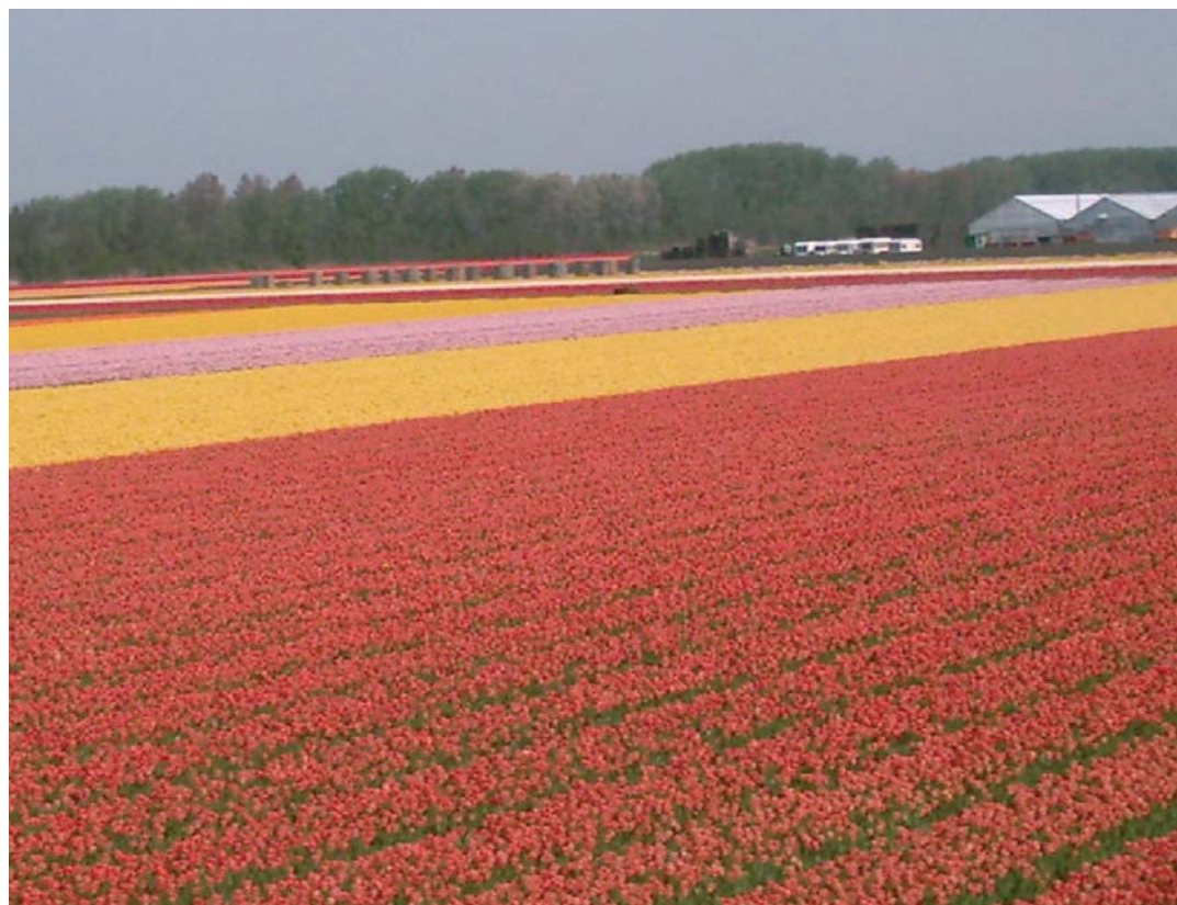
Bollenvelden aan de Zilverduinweg