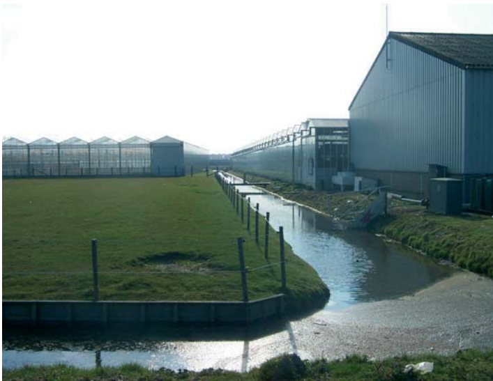
Glastuinbouwgebied Trappenberg-Kloosterschuur in Rijnsburg

Glastuinbouw is een van de pijlers van de greenport Duin- en Bollenstreek. De Stuurgroep Pact van Teylingen onderkent het belang van dit concentratiegebied voor kassen en is op 14 januari 2005