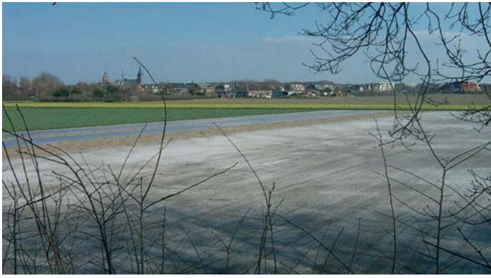
De Vinkenveldpolder in Noordwijk

beteren. De gemeente Noordwijk zoekt, in samenwerking met de regio Holland Rijnland, naar de financiële dekking van deze kostbare ingreep. Deze module is onderdeel van de plannen voor het hele Middengebied tussen Noordwijk Binnen en Noordwijk aan Zee.