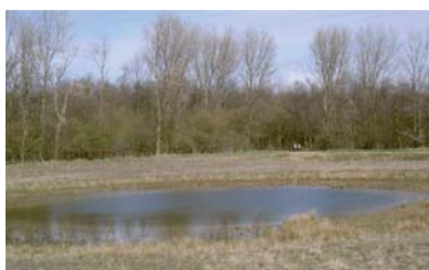
Natuurontwikkeling in het Langeveld

In het Langeveld wordt sinds 2002 gewerkt aan natuurontwikkeling. Aan weerszijden