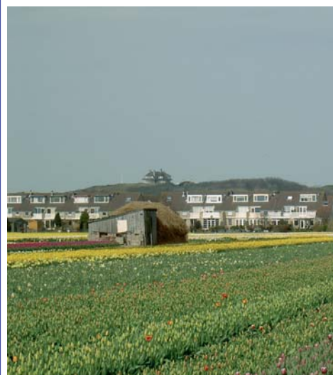
Het Middengebied in Noordwijk

Noordwijk is bezig met een structuurschets voor het Middengebied tussen Noordwijk- Binnen en Noordwijk aan Zee. Daar maakt