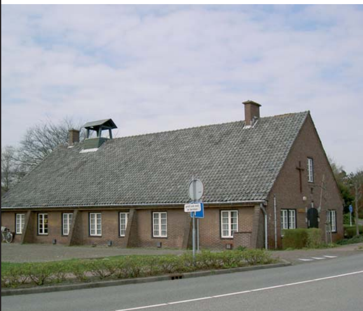
Eén van de marinebarakken in Valkenburg

nen. Om de kwaliteit van het agrarisch landschap nog te verbeteren moeten er enkele opstallen verplaatst worden en moet de waterhuishouding worden verbeterd. Tegen de duinen aan kunnen ecologische en recreatieve zones een plek krijgen.