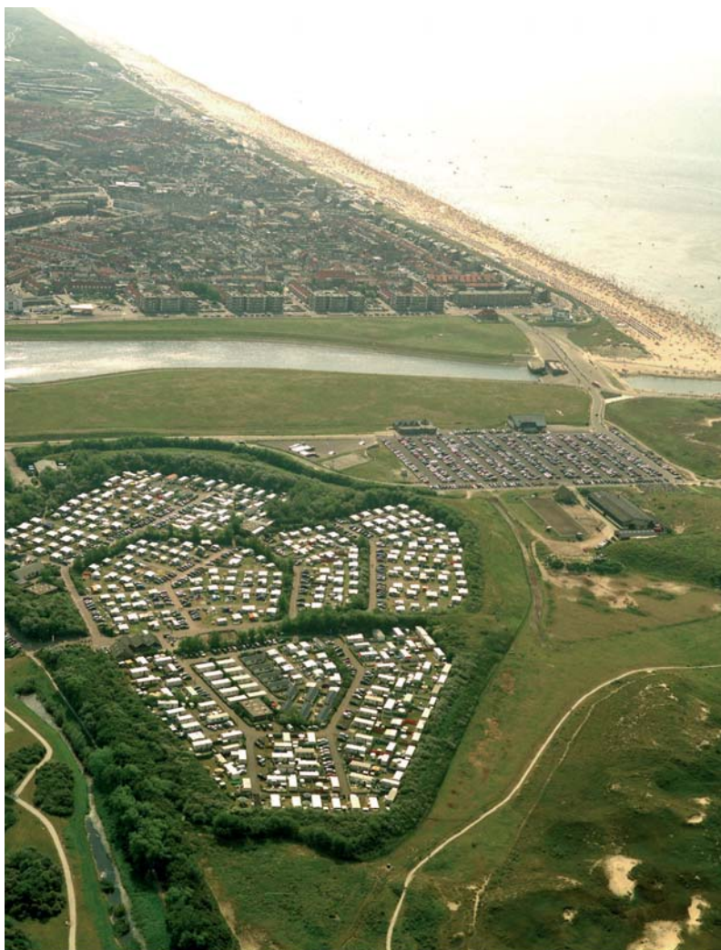
Camping De Noordduinen in Katwijk.