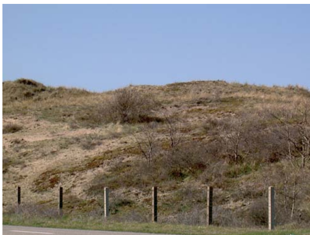
De duinen bij Langevelderslag