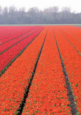
Bollenteelt tegen de duinrand bij De Zilk

Het programma van het congres vindt u op de achterzijde van deze nieuwsbrief.