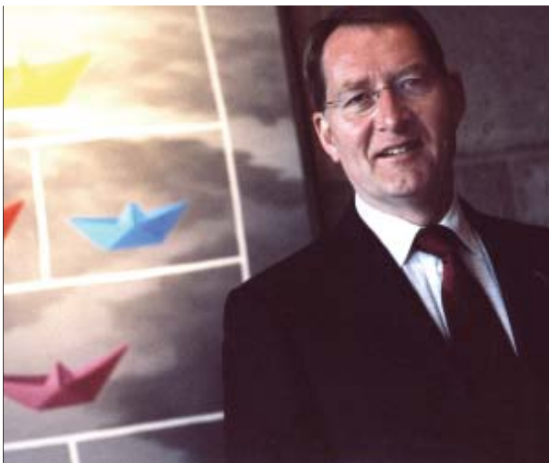
“Het is verstandig dat bij de vorming van Holland Rijnland de ‘bottom up’-aanpak is gekozen”.

“Het uitgroeien van Holland Rijnland tot een Wgr-plusregio is niet alleen een kwestie van ambitie,” meent