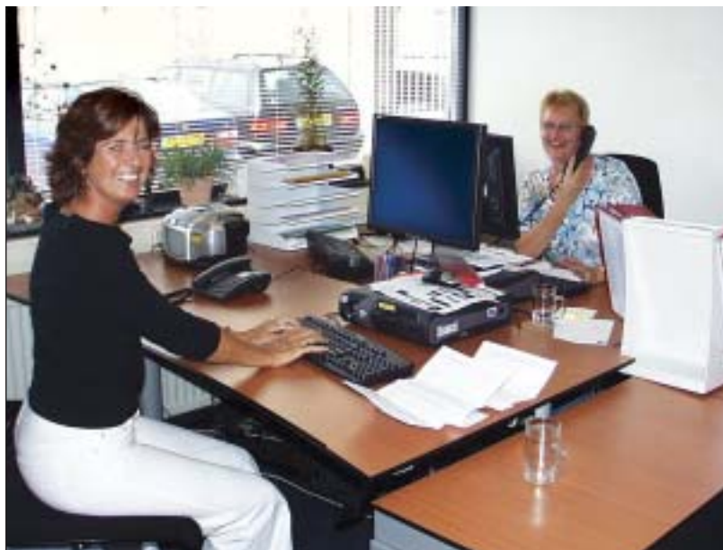
Aan de RIO-telefoon worden veel vragen beantwoord en start het proces van indicatiestelling.

Op basis van de boedelbeschrijvingen van de RIO's zijn de (ambtelijke) gesprekken met het CIZ gestart over de boedeloverdracht. Die gesprekken moeten leiden tot een boedelprotocol op grond waarvan gemeenten worden geacht om het CIZ vanaf volgend jaar aan te wijzen als het