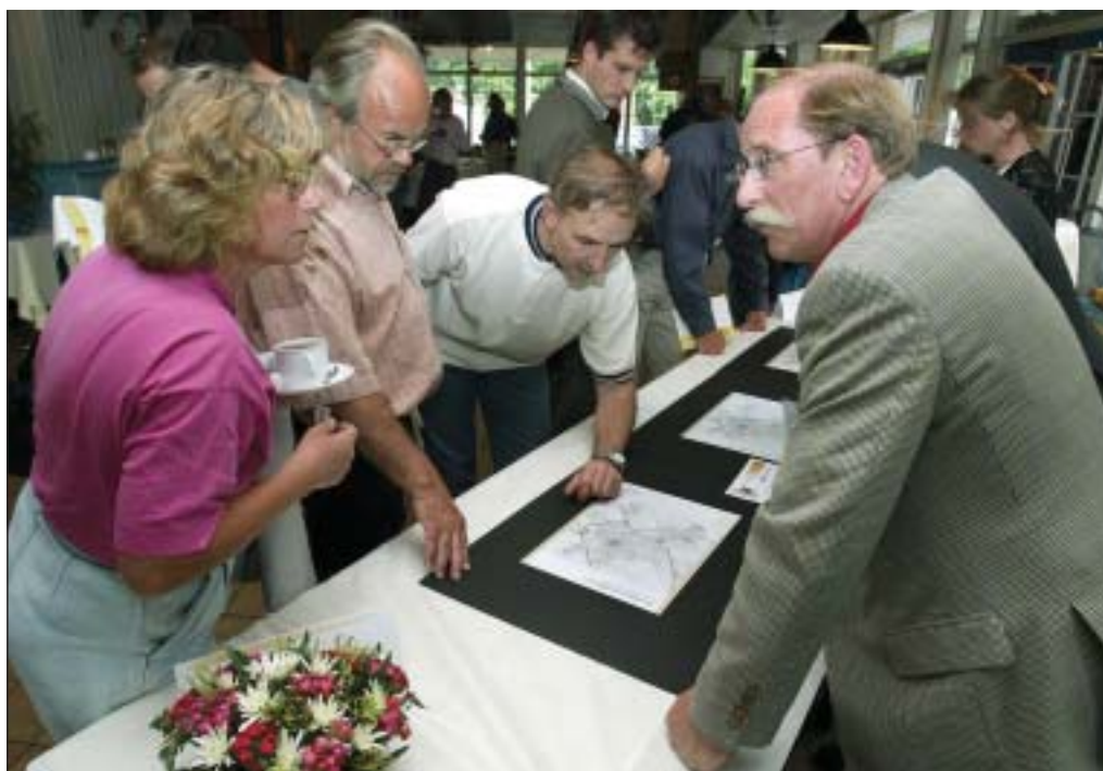
Informatiebijeenkomst over de RijnlandRoute in Oegstgeest.

"Om de verkenning van de verschillende tracés voort te zetten hebben we eind juni een bureau ingeschakeld dat de maatschappelijke kosten-/batenanalyse (MKBA) uitvoert en de nodige verkeerskundige berekeningen maakt. Dat betekent niet dat verder overleg met de regio zinloos is. In het najaar komen de klankbordgroepen weer bijeen en vóór 15 oktober verwachten we de reacties van de gemeentebesturen op de wegingscriteria. De uitkomsten van de hele maatschappelijke ronde worden vastgelegd in een advies aan de stuurgroep en na goedkeuring van deze stuurgroep verwerkt in de definitieve versie van de projectopdracht. We proberen bij alles zo ▶