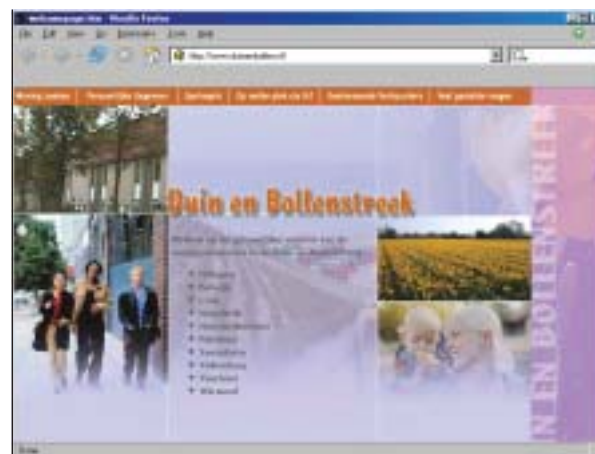
Woningbouwcorporaties in de Duin- en Bollenstreek werken nu nog samen via de website duinenbollen.nl.

De Greef: "De regio kan volop profiteren van de kennis en deskundigheid die wij in de loop der jaren hebben opgebouwd. Wij verdelen de huurwoningen en krijgen de huur-