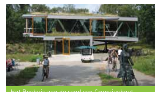
Het Boshuis aan de rand van Cruquiusshout