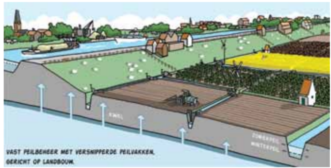
Het huidige watersysteem

Het huidige watersysteem in Haarlemmermeer is ingericht op de landbouw: een laag waterpeil in de winter met veel afvoer van overtollige neerslag en inlaat van water in de zomer om de tekorten aan te vullen. Het is een niet-duurzaam systeem dat bovendien niet ingericht is op klimaatveranderingen met meer regen, maar ook met meer droge periodes.