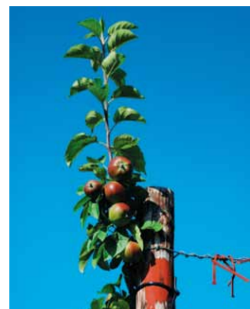
Appelboomgaard De Olmenhorst