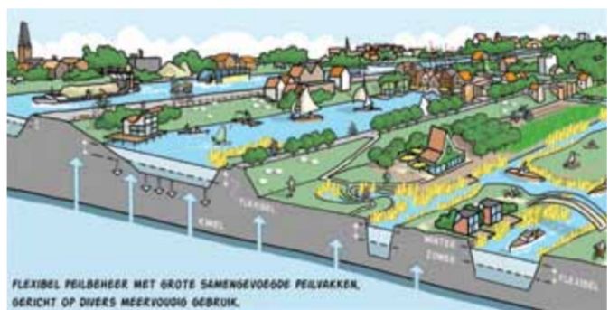
Het nieuwe watersysteem

Daarnaast krijgt Westflank 1 miljoen m³ piekberging, een opvangbekken om tijdelijk water op te vangen bij extreme neerslag. Via een inlaat wordt het overtollige water uit de Ringvaart naar deze piekberging gelaten. De berging is een open stuk land, bijvoorbeeld een moeras- of natuurgebied. Met dijken eromheen die een mooi uitzicht geven. Eens in de tien of vijftien jaar loopt die piekberging onder met water.