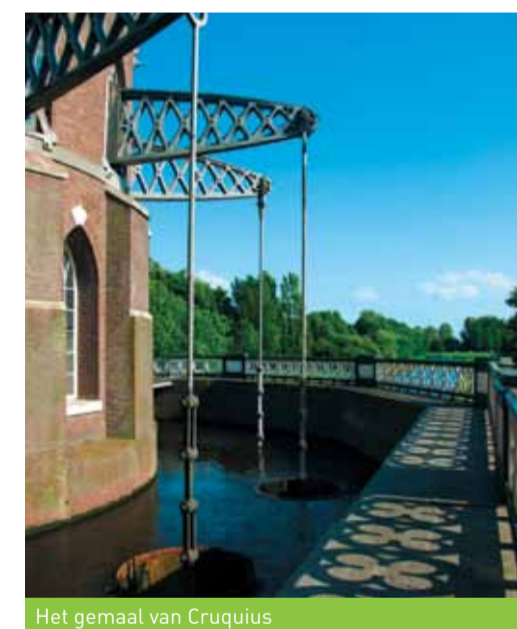
Het gemaal van Cruquius