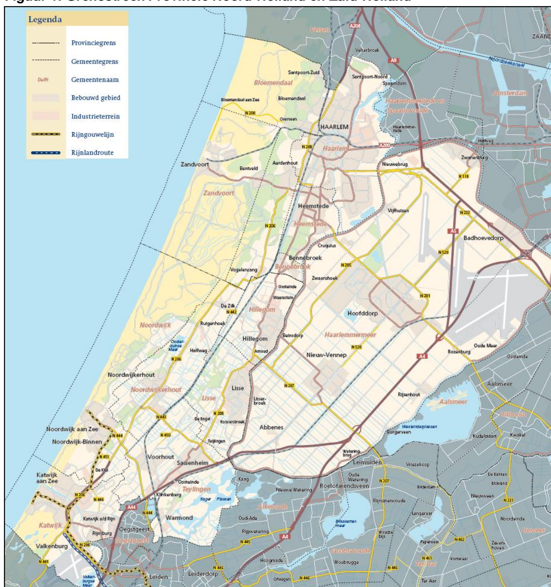
Figuur 1: Grensstreek Provincie Noord-Holland en Zuid-Holland

In de Samenwerkingsagenda geven partijen aan welke maatregelen zij wenselijk achten om de verkeerinfrastructuur beter toe te rusten voor de bereikbaarheid van de economische functie van de grensstreek en tegelijk de leefbaarheid in het gebied te verbeteren. De Samenwerkingsagenda heeft een dynamisch karakter, waarin de gemeenschappelijke aanpak voorop staat en partijen aangeven hoe zij de uitwerking van de gewenste maatregelen ter hand willen nemen en de financiering willen regelen. Binnen de budgettaire mogelijkheden is prioritering van maatregelen noodzakelijk. Daarbij is een integrale aanpak van verkeerskundige maatregelen en ruimtelijke ontwikkelingen essentieel.